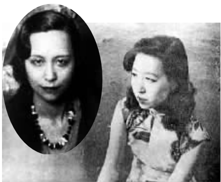
圆图:张爱玲母亲黄素琼(后改名黄逸梵) 大图:1944 年《杂志》月刊刊登的张爱玲照片

对于张爱玲来说,“母亲”这个词儿,带给她的可谓是悲喜交集的感受。一度,她视母亲如神,希望能靠着母亲摆脱苦海,可后来两人的关系却急转直下。最后,母亲黄素琼去了欧洲,张爱玲移民美国,两人至死都未曾再见一面。