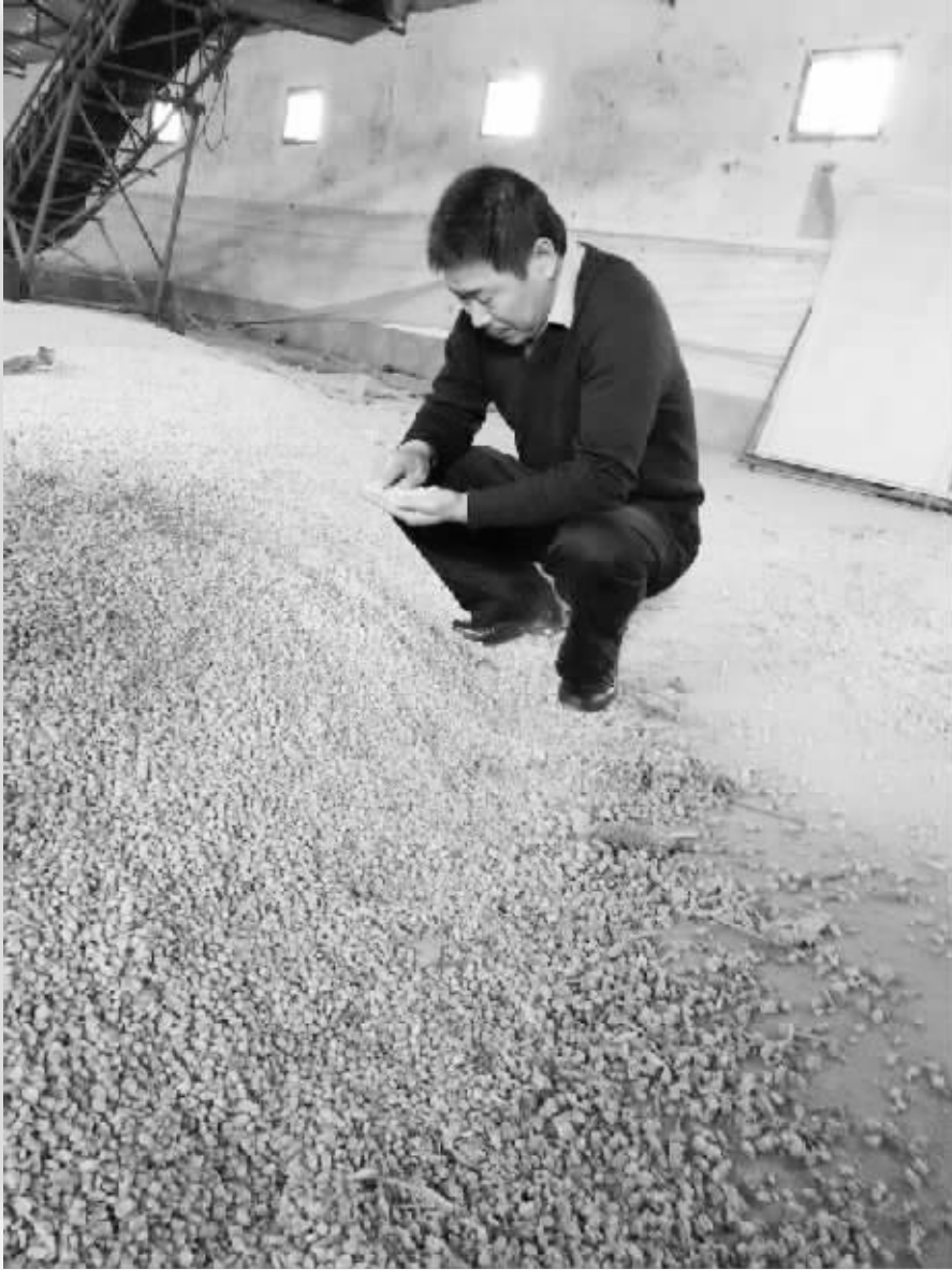
盖会章在仓库察看粮食储备情况