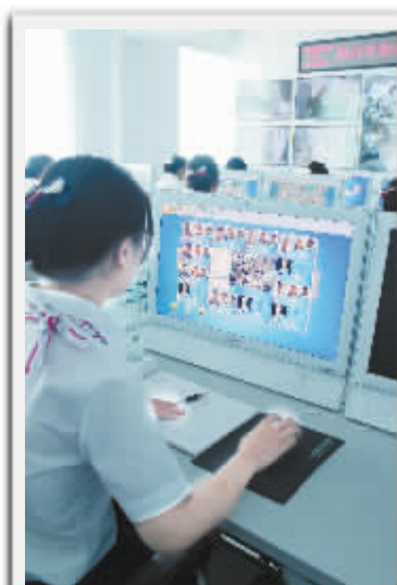
工作人员逐一核对考生的现场照片、身份证照片以及档案照片