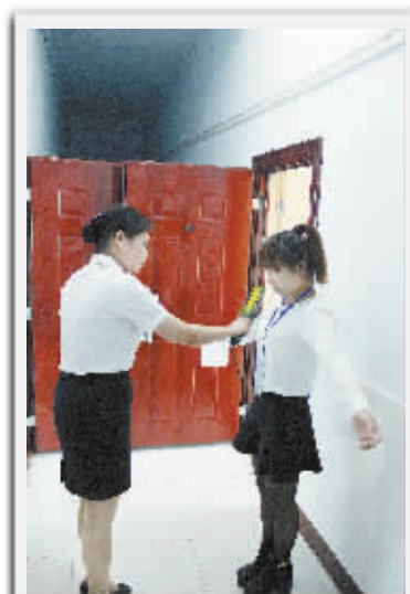
有工作人员用金属探测仪扫描考生

周口手外科医院 周口市新农合医保定点医院 地址:周口市大庆路与文昌大道交叉口 电话:0394—8288120