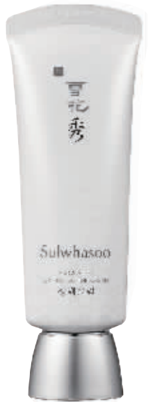
雪花秀 水律莹润提拉防晒霜

防晒系数:SPF 30+/PA+++内含增强型 UVA/UVB 防护,强大的抗氧化成分和镇定防刺激成分,防止色斑生成。可作防护底妆。