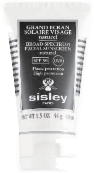
希思黎 防晒隔离霜

防晒系数:SPF 50+/PA+++黄芩萃取物拥有优越的抗炎 & 抗氧化效果,海草萃取物的水律微囊,给肌肤提供水分,加强肌肤弹性。粉状乳化科技,减少防晒霜的油性或黏性。