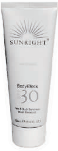
如新 晒特丽防晒乳

防晒系数:SPF 30+/PA+++有“防晒小金刚”的昵称,清爽透薄,高倍防晒指数,安全有效,外形超薄。