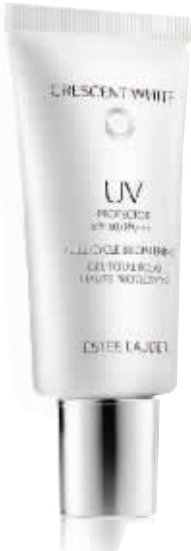
雅诗兰黛 晶透沁白防晒霜

防晒系数:SPF 30+/PA+++玉米籽提取物能激发表皮细胞能量,显著增强抵御能力。凝聚金纯系列特有的 Pro - XylaneTM 卓颜分子、亚麻籽提取物,有效减少皱纹。