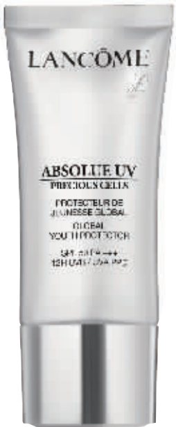
兰蔻 菁纯臻颜防晒隔离乳

防晒系数:SPF 50/PA+++红光渗透粉末”科技,隔绝 UVA、UVB 等容易产生肌肤问题的光波,智慧地将阳光中对肌肤有益的红光留下。添加了亮采复合精华和抗氧化配方,预防光老化。