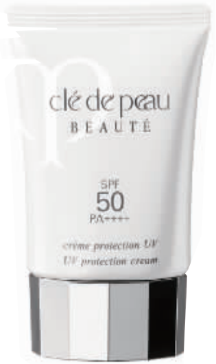
肌肤之钥 防晒乳霜

防晒系数:SPF 30/PA+++质感如精华素一般透薄清爽不黏腻,蕴含升级版透明质酸乙酰,防晒抗氧同时提升美肌功效。