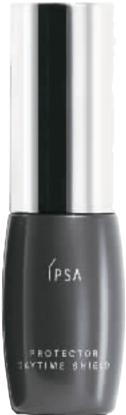
IPSA 全效修护防晒日霜

防晒系数:SPF 50/PA++++将深层保湿的酵母精华的有效成分糅于细腻柔滑的 cc 霜中,提升细胞的透明度和光泽感。