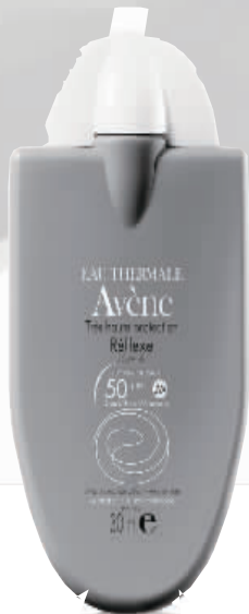
雅漾 清爽倍护便携防晒乳

防晒系数:SPF 50/PA+++强大的UV 过滤系统,12 小时长久隔离紫外线侵害;向日葵籽精粹+天然紫糯米精粹+维生素 E+牛油果籽精粹,抵御自由基的生成,阻隔重金属等城市污染物。