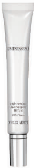
阿玛尼 曜白亮彩润色防护霜

防晒系数:SPF 30 防护、抗老、保湿、兼具粉底功能的防晒品,蕴含多种植物精华,清爽不油腻。