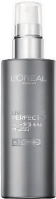
巴黎欧莱雅 多维防晒轻透隔离喷雾

防晒系数:SPF 30/PA++++“智能防晒”复合配方,外层抵挡紫外线对肌肤的侵害,内层有效渗透美白精华至肌肤底层,并促进肌肤蛋白质生成。