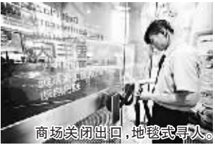
商场关闭出口,地毯式寻人。