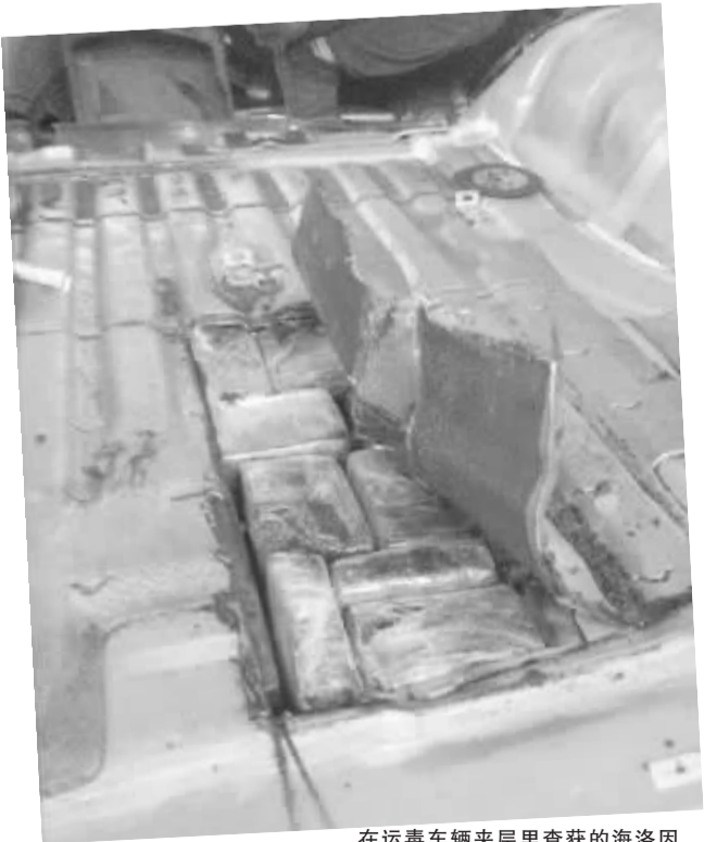
在运毒车辆夹层里查获的海洛因