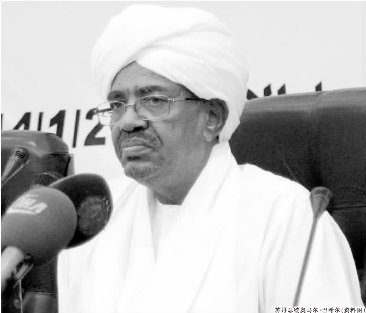
苏丹总统奥马尔·巴希尔(资料图)

苏丹总统奥马尔·巴希尔当地时间 6 月 15 日结束在南非约翰内斯堡举行的非洲联盟（非盟）第 25 届峰会行程，乘专机返回苏丹首都喀土穆。 巴希尔走出舷梯面带微笑、高举权杖，意在向国民昭示“我一切安好，已平安归来”。至此，一场各方关于巴希尔去向的猜测随之收场。