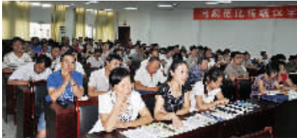
2014年,周口报业书画培训中心与市教育局共同举办周口市首届书法骨干教师培训班。