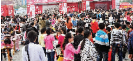
由周口报业书画培训中心与市教育局共同举办的周口市首届青少年书画大赛比赛现场。