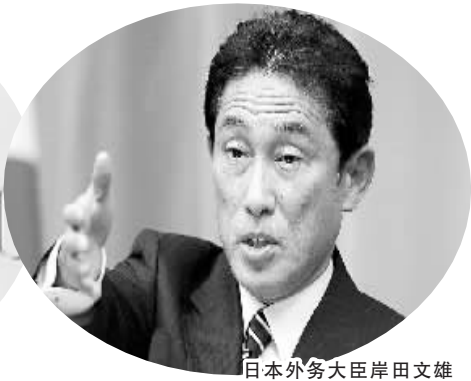
日本外务大臣岸田文雄