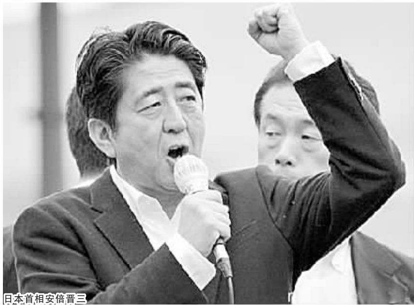
日本首相安倍晋三