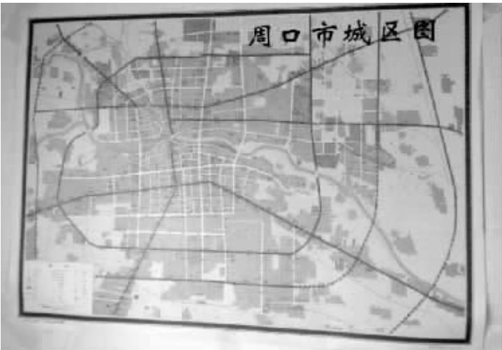
最新版周口市城区图