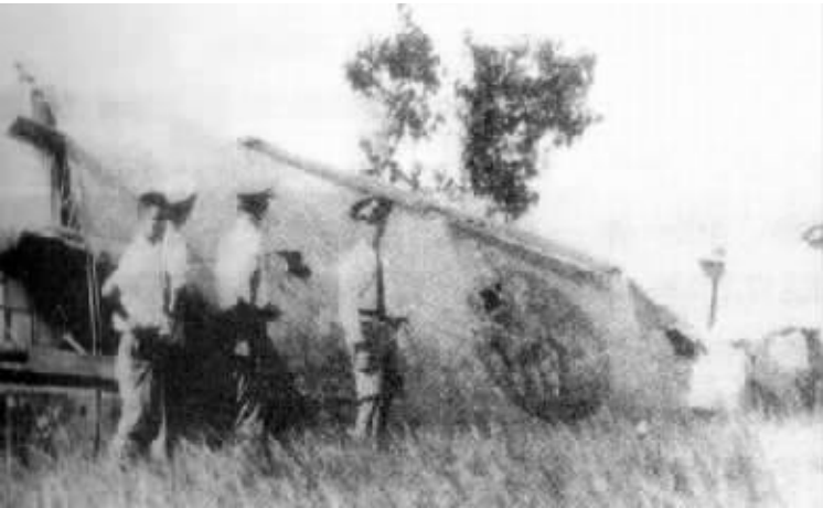
被高志航击落的敌机残骸