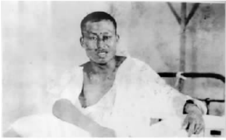
1937年8月15日，高志航与日机空战时受伤