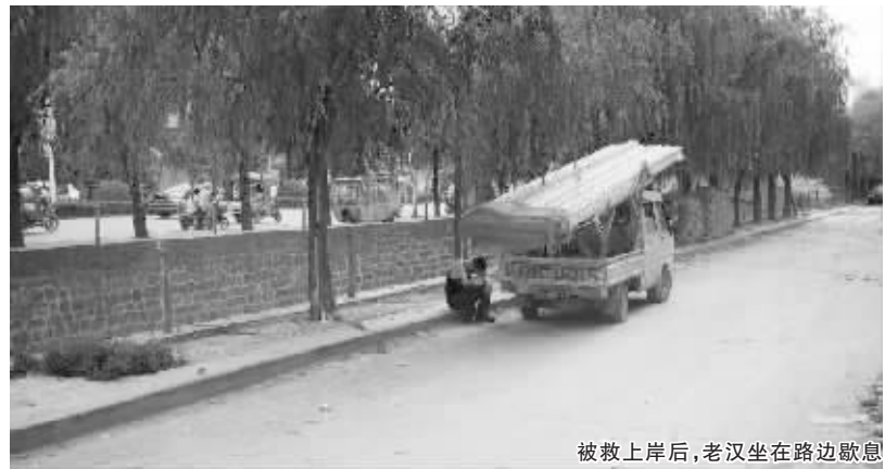
被救上岸后,老汉坐在路边歇息