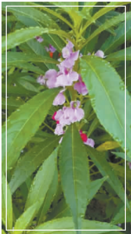
雨后的指甲草开出的美丽小花,带着晶莹的雨滴,安静绽放。它既不张扬,也不惹眼,但仅仅就那股清新,就足以让人为它驻足。