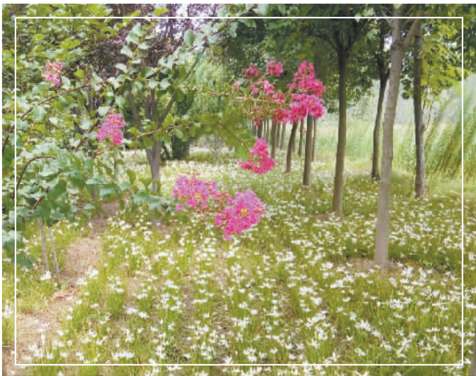
小草、小花虽不起眼,却把大地装扮得秀气无比。 @ 微友 谷志方