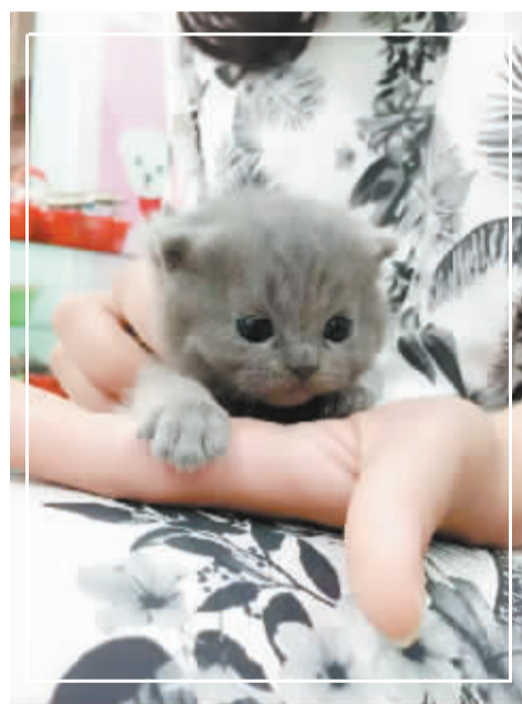
可爱的小猫咪,让我把你带回家吧! @ 微友 果。