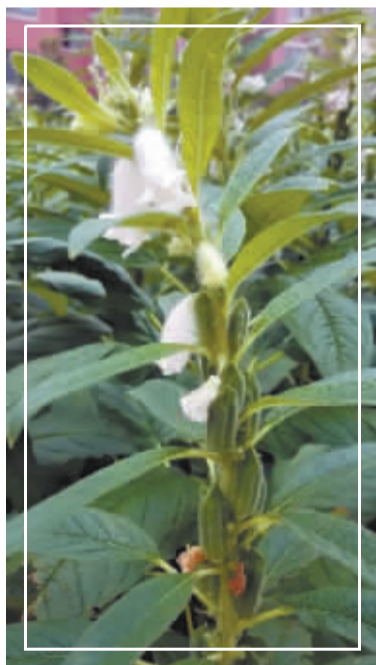
芝麻开花节节高,用心感悟生活,心中每天都有一幅画,日子温馨而美好。 @ 微友 范娜娜