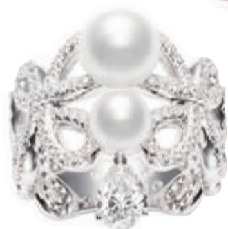
伯爵“璀璨华裳”系列戒指

我们的观念也需要进化了！事实上，有着沉静温润美丽光泽的天然好珍珠依旧难得，价格与其他贵重宝石也不相上下，而珍珠首饰早已经不是我们印象中的那般——而是与时俱进拥有了更多表达方式与前卫设计，一样年轻化、一样摩登时尚！