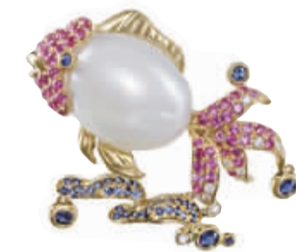
周大福名贵珠宝 18K 金镶珍珠首饰