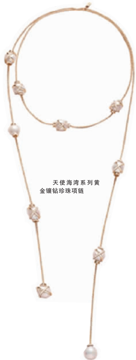
天使海湾系列黄金镶钻珍珠项链