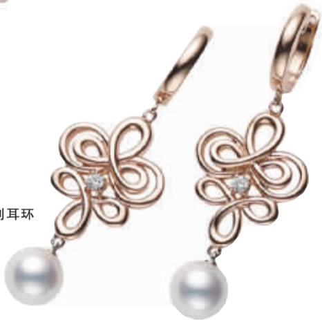
御木本 Ruyi 系列耳环