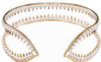
TASAKI“奇玫瑰宝”系列手镯