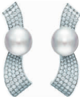
谢瑞麟“珠光瑰宝”系列耳环