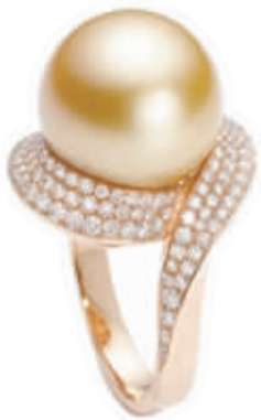
周生生 LA PELLE 南洋养殖珍珠钻石戒指