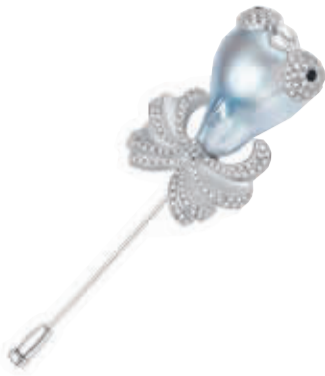
ASTER MA 高级珠宝定制小金鱼珍珠胸针