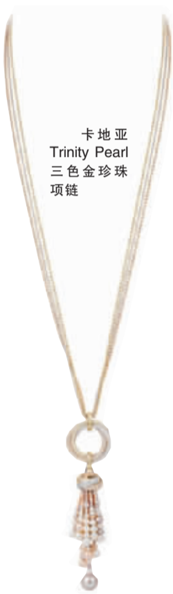
卡地亚 Trinity Pearl 三色金珍珠项链