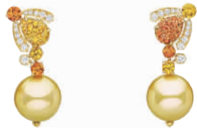
尚美巴黎 蜂·爱系列珍珠耳环