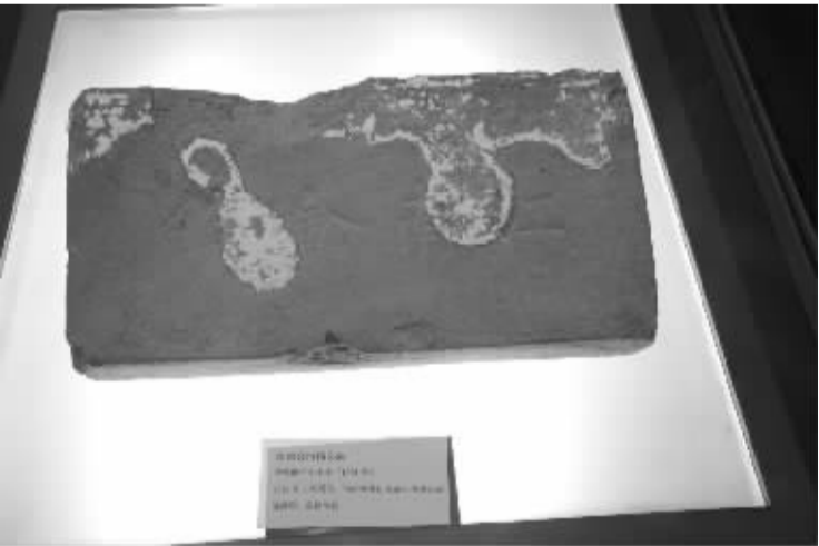
收藏在市博物馆的江南会馆青砖。