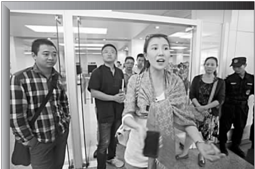
一名女乘客在讲述飞机上发生的情况

从成都飞往北京的联合航空 KN5216 次班机上,竟有乘客在飞机加油以及飞行过程中吸烟,被其他乘客和乘务员发现。有乘客要求重新安检,机长决定继续飞行,引发机组人员与未吸烟乘客的冲突。8 月 31 日上午,多名乘客滞留在北京南苑机场,要求航空公司给说法。中联航 9 月 1 日上午回应,当日值班领导已第一时间到场致歉并赔偿。