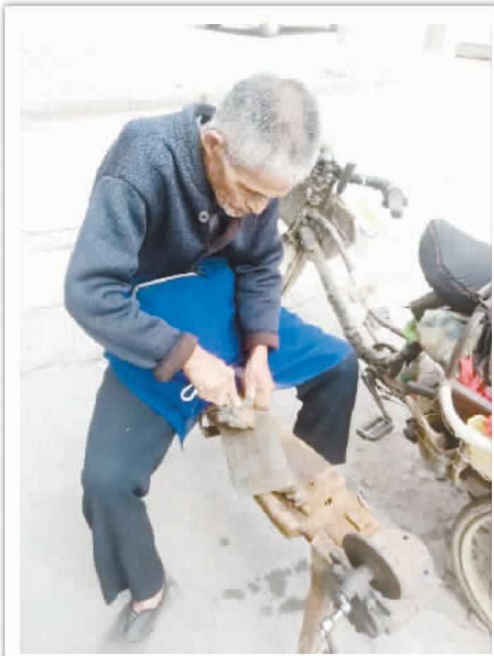
“磨剪子嘞戥菜刀……”难道以后只停留回忆里? □周口晚报 王晨