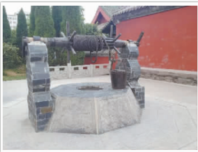
明道宫里的一口古井, 经历时间和风雨的洗礼, 见证着历史变迁, 诉说着古老的故事。 @微友 人见人爱