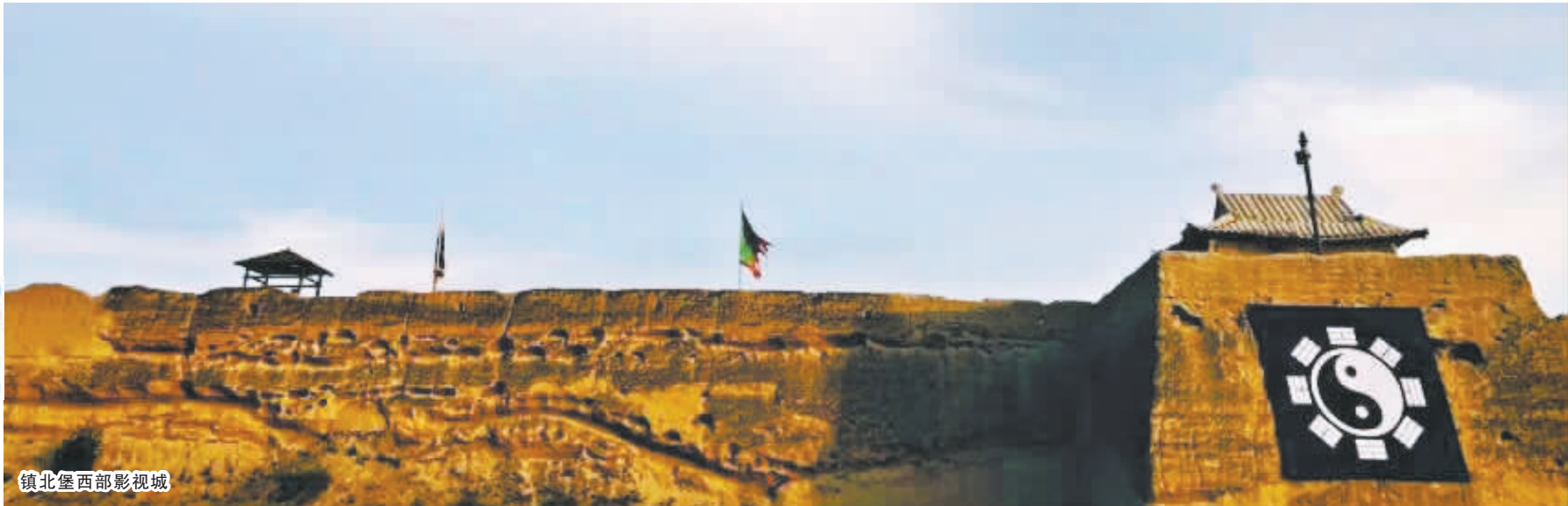
镇北堡西部影视城