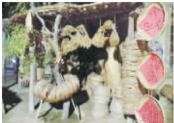
镇北堡西部影视城一角