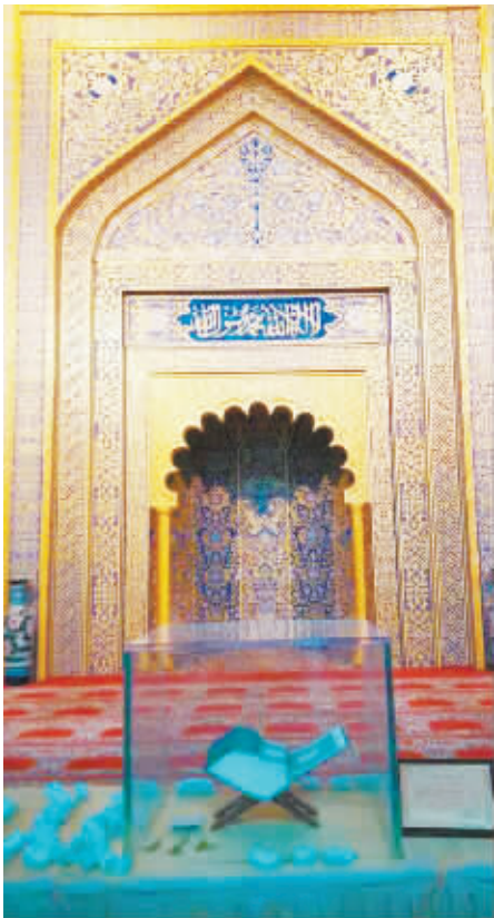
中华回乡文化园礼仪大堂