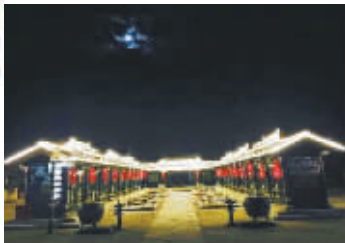
镇北堡西部影视城夜景