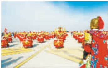
银川通用机场开航仪式演出现场