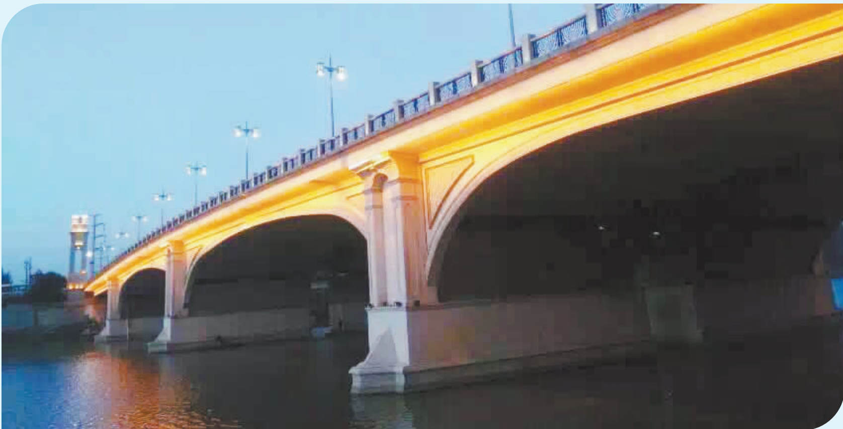
角度不同世界就不同,让我们换个角度看周口吧! @微友 小朱爱周口