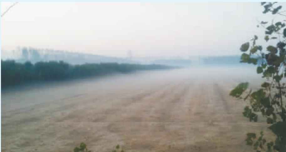
清晨的田野里,满眼的土黄色和远处朦胧的乳白色的晨雾,勾勒出了一幅美轮美奂的乡村美景。 @微友 孙国勇