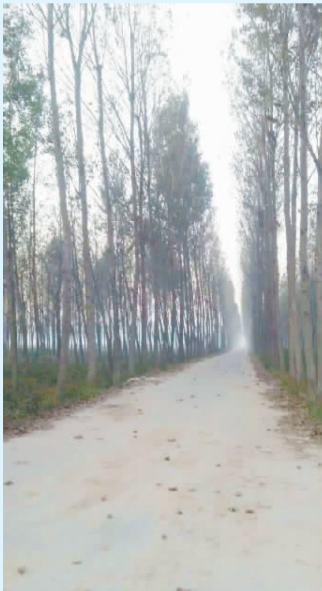
独自漫步于一眼望不到尽头的幽静的林间小道,倾听树叶飘零的声音,用心感受秋天带来的凄美。 @微友 樊卫东