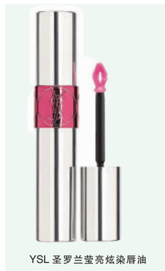
YSL 圣罗兰莹亮炫染唇油