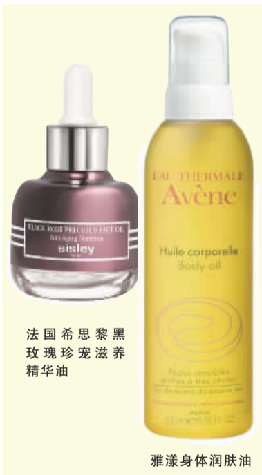
法国希思黎黑玫瑰珍宠滋养精华油

专家说: 油性肌肤并非不能使用“精华油”产品,要试情况而定,譬如肌肤屏障受损的痘痘肌,在使用祛痘产品前涂抹对皮肤有益的植物油(深海两节荠籽油、巴巴苏籽油、白池花籽油、刺阿干树仁油),里面蕴含的不饱和脂肪酸等成分可以辅助修复受损肌肤,降低皮肤水分散失,并且不会堵塞毛孔。但如果是敏感性肌肤,不管是否是油性肌肤,都要慎重选择。