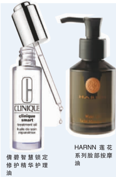
倩碧智慧锁定修护精华护理油

专家说: 精华油通常是调配过的化妆品,更像是精华,可直接使用,但精油则是从植物中提取出来的纯油性产品,通常纯度比较高、成分也比较复杂,需要按比例稀释之后加基础油调配使用。品牌若是在植物油的基础上再添加“精油”成分,其实与芳香精油差不多,但芳香精油更有针对性,可以按需调和。从商业配方而言,许多精华油不是以“纯植物油”为基础油,而是添加了高比例“挥发硅”来创造快速吸收的效果,虽然无碍,但与诉求“高纯”的芳香疗法已有距离。