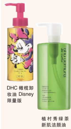
DHC 橄榄卸妆油 Disney 限量版

专家说: 传统的指甲油中所用的溶剂、塑化剂、成膜剂、VOC 挥发溶剂等,从吸入到渗透进肌肤都是有毒的,怀孕哺乳期建议不要涂抹。日常涂抹注意通风,并且要选择信誉佳的品牌,才会为“美丽”加分。另外还可以着重看一下成分,甲醛、甲苯以及塑化剂等都是有害成分,要尽量避免。