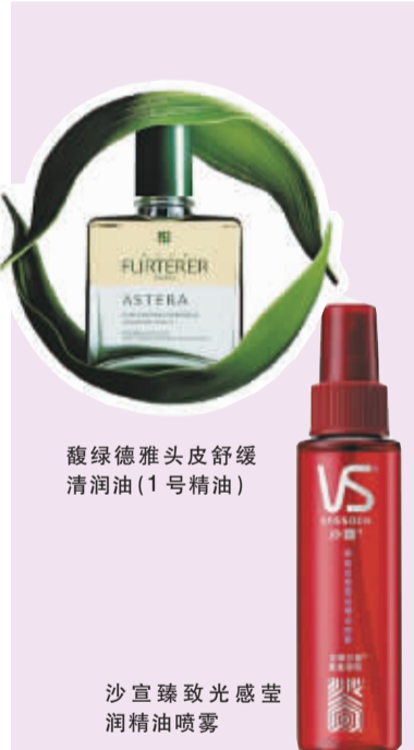
馥绿德雅头皮舒缓清润油(1号精油)

专家说: 许多护发精油是以挥发硅和不会挥发硅为主架构,精油为辅,刚涂抹时觉得油腻,但过了几分钟就会干爽不腻,这是大部分挥发油挥发掉了的结果。油性发质建议在刚洗后使用,且尽量涂抹在耳朵以下的头发。并且油性发质最好选择茶树、薄荷精油等产品,对平衡油脂有很好的作用。