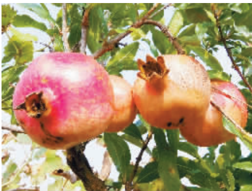
金秋，在小院、在塘边、在墙头、在田野，果实压弯了枝头，不经意间砸了你的头，碰了你的腰。疑惑那是谁家淘气的孩子，回头看看，莞尔一笑。