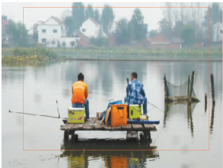
东湖一隅，绿树黄花，白墙红瓦。虽无二月桃花，却有水涨鱼肥。湖中垂钓，悠然自得，斜风细雨不须归！