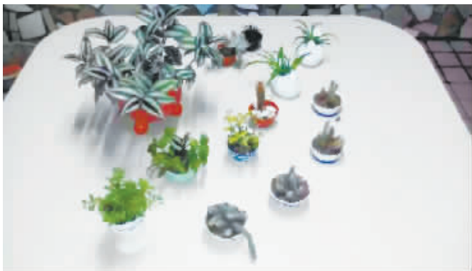
这些掌上的风景，都是俺的新作哟！