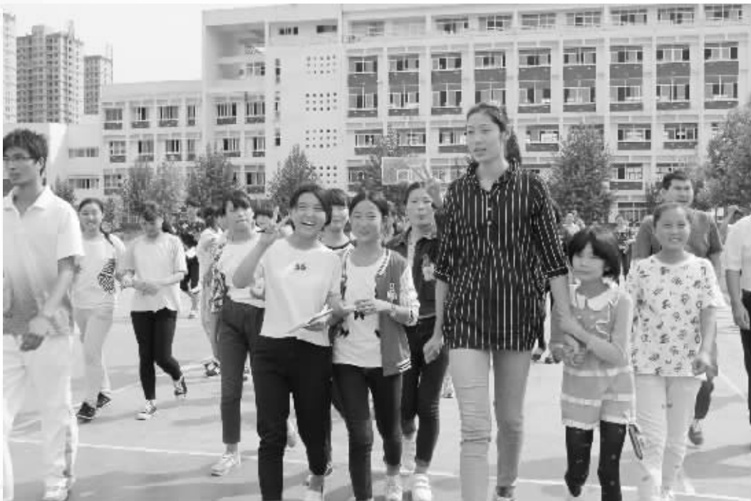
朱婷与家乡学子互动