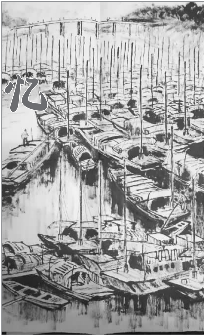
葛庆亚画的桅杆晚照景色

“为纪念毛主席‘一定要把淮河治理好’题字25周年,我市摄影人士拍摄了一组淮河流域的照片。我根据这组照片,加上之前的写生画稿,手绘了周口老城区全貌,涵盖周口八景,取名‘昔日家园’,希望这幅画能唤起周口人共同拥有的一段记忆。”