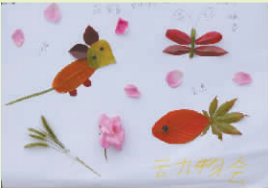
小记者:苑家豪 编号:150168 周口实验小学四(5)班