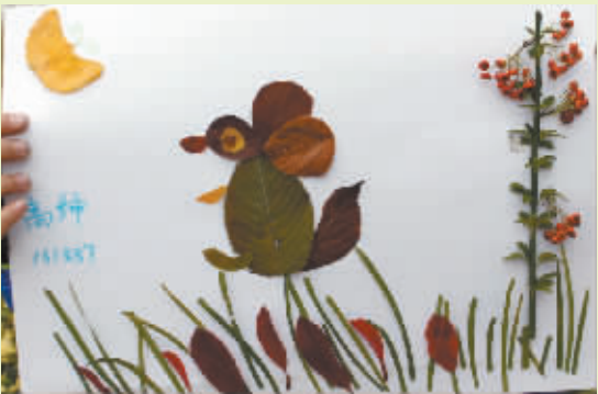
小记者:高绅 编号:151837 周口六一路小学四(1)班