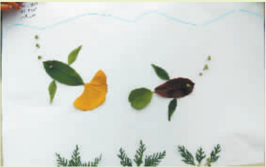
小记者:王馨娴 编号:152425 周口七一路二小三(3)班

小记者:刘畅豫 编号:151795 学校:周口六一路小学三(2)班 周六上午,我和其他小记者来到周口公园参加活动。一路上,我们走走停停,老师一边给我们讲如何做树叶贴画的技巧,一边让我们根据自己要做的图画来收集树叶,这次,我打算制作一只孔雀。 搜集完树叶,老师发了一张白纸,开始制作。我用剪刀把树叶修剪成自己想要的形状,再用胶水和双面胶把树叶贴到纸上。我把椭圆形的树叶修剪成圆形的,当孔雀的头和身体,把柳树的长叶子当孔雀的脖子,用小草当孔雀的腿和脚,最后,我用很多的芦苇当翅膀,费了九牛二虎之力,一只栩栩如生的孔雀终于诞生了! 看着亲手做的图画,我又高兴又兴奋,好有成就感啊!老师夸我做得好,我心里美滋滋的!听到老师点评其他同学的画,我也学到了一些技巧和方法。这次活动给我带来的收获很大,教会了我很多种作画的技巧,也锻炼了我的动手能力! (辅导老师:李雪梅)