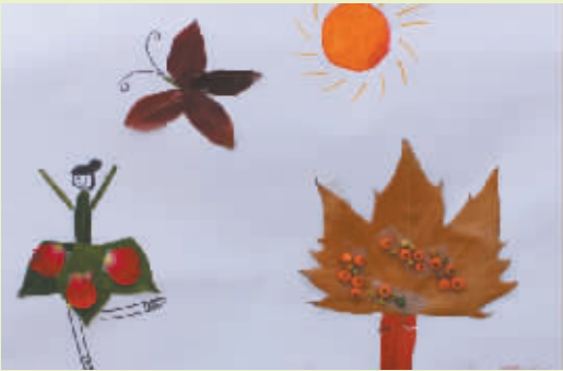
小记者:高韵淇 编号:150641 周口作坊小学四(4)班