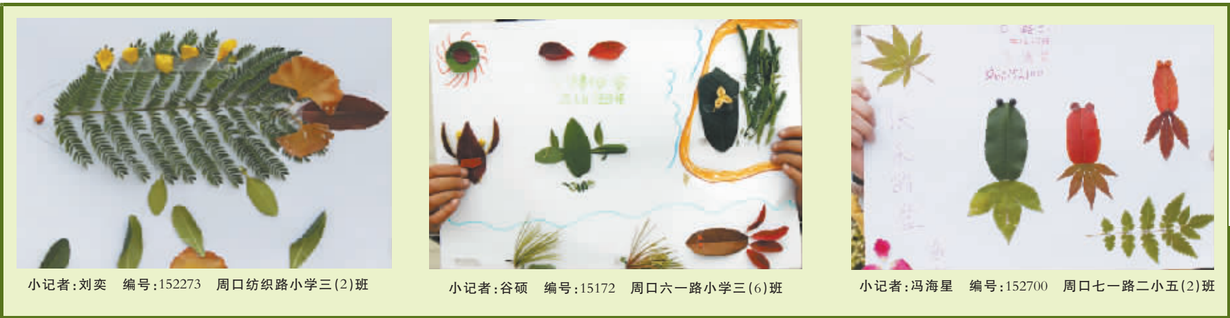
小记者:刘奕 编号:152273 周口纺织路小学三(2)班 小记者:谷硕 编号:15172 周口六一路小学三(6)班 小记者:冯海星 编号:152700 周口七一路二小五(2)班