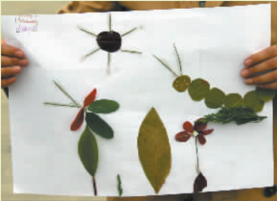
小记者:宋雨辰 编号:152509 周口六一路小学四(3)班