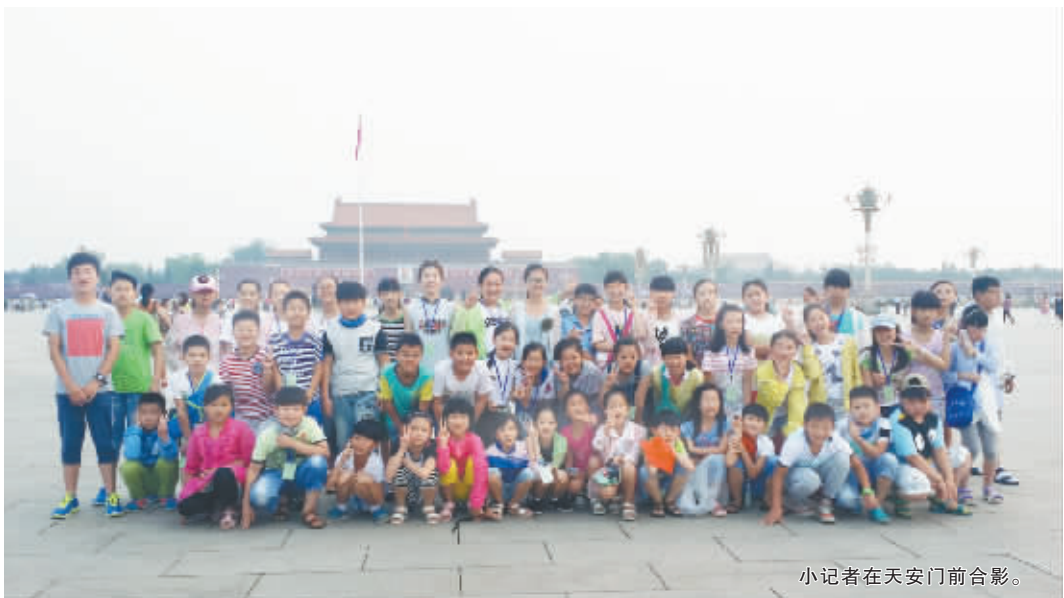
小记者在天安门前合影。