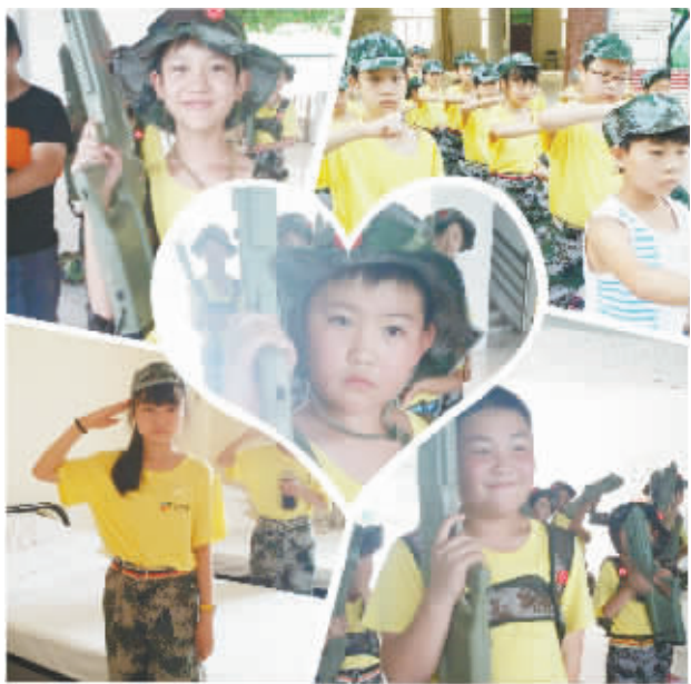
我们是军营小小战士。

以下是《周口晚报》西华县小记者 2015 年部分活动掠影,让我们一起来感受孩子们的快乐吧!