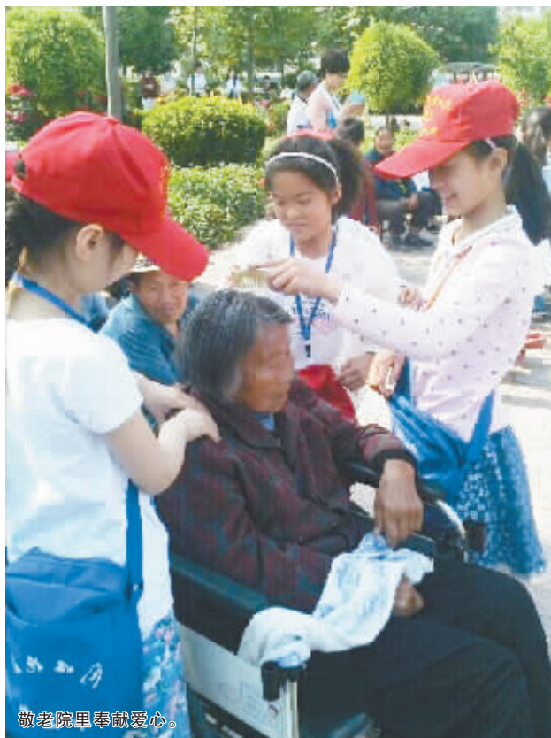
敬老院里奉献爱心。