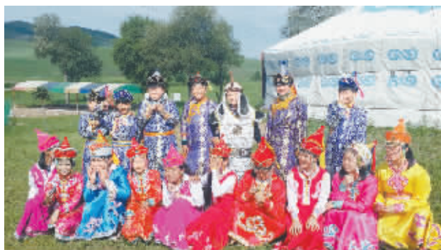
穿上漂亮的蒙古服,猜猜我是谁。