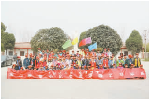
小记者园艺场采风。