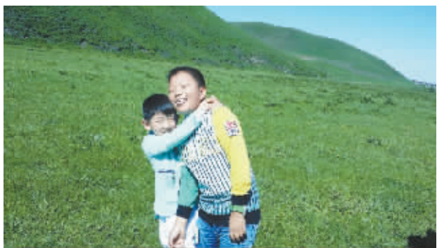
辽阔草原留下我们的欢声笑语。