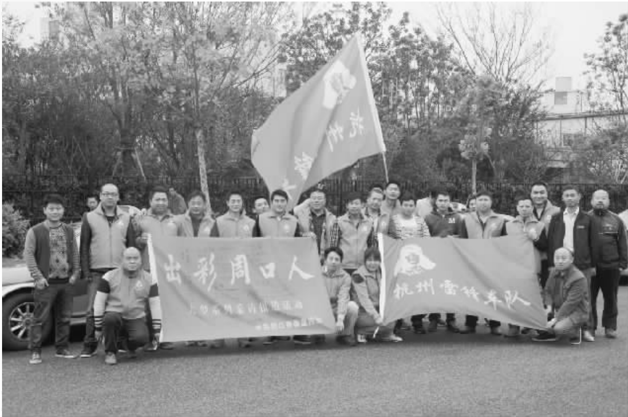
杭州雷锋车队部分成员与“出彩周口人”采访组合影

2015年1月27日是马年腊八节，杭州雷锋车队联合当地茶馆送出3.5万份爱心粥，温暖了社区困难群体及为这座城市