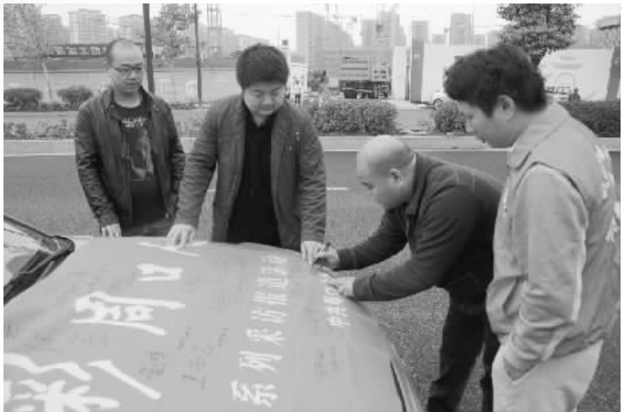
杭州雷锋车队一位出租车司机在“出彩周口人”彩旗上签名