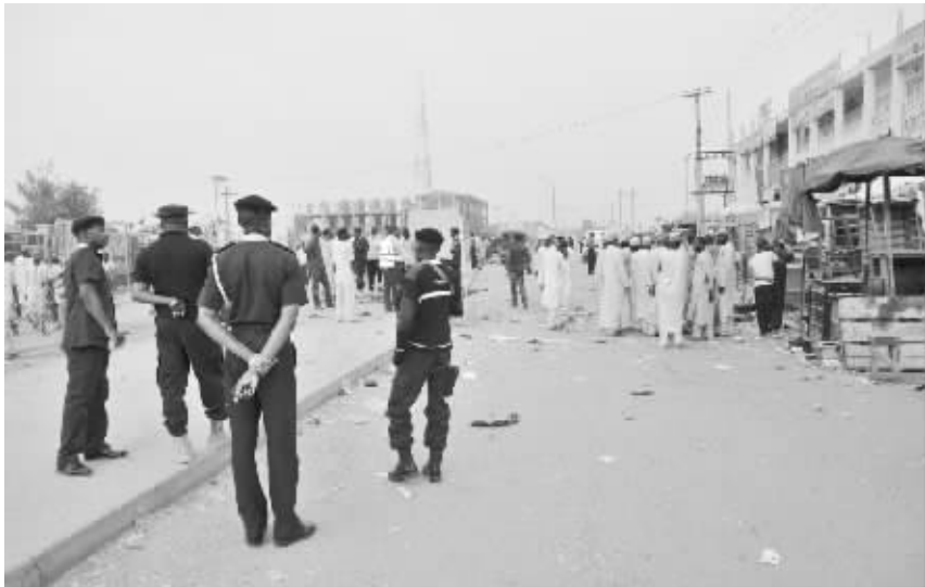
11 月 18 日，在尼日利亚北部卡诺州首府卡诺市，安全人员在手机市场连环自杀式袭击现场外执勤。 尼日利亚北部卡诺州首府卡诺市的一个手机市场 18 日遭遇连环自杀式袭击，目击者说袭击造成数十人死伤。