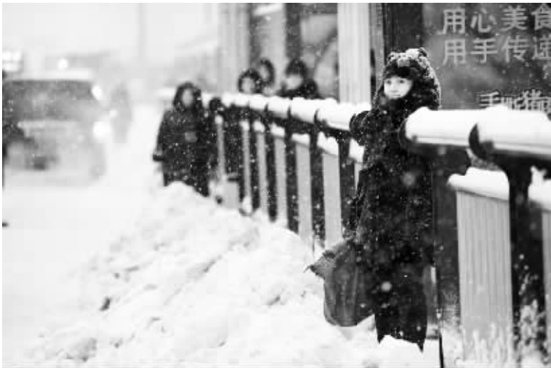
12 月 2 日,在哈尔滨市中山路上,市民在公交站台等车。 当日,黑龙江省多地遭遇暴雪。12 月 1 日至 2 日,黑龙江省气象台连续三次发布暴雪黄色及蓝色预警。