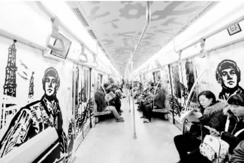
12 月 2 日,市民乘坐沈阳地铁二号线“国之长子”列车车厢。 12 月 1 日,“沈阳历史”主题地铁列车亮相沈阳地铁 2 号线。该列车包括“新乐初民”“奉天承运”“血沃黑土”“国之长子”“地铁时代”“凤凰涅槃”六节车厢。车厢内通过一系列图案、绘画及装饰,让乘客近距离感受沈阳的历史变迁。 新华社发