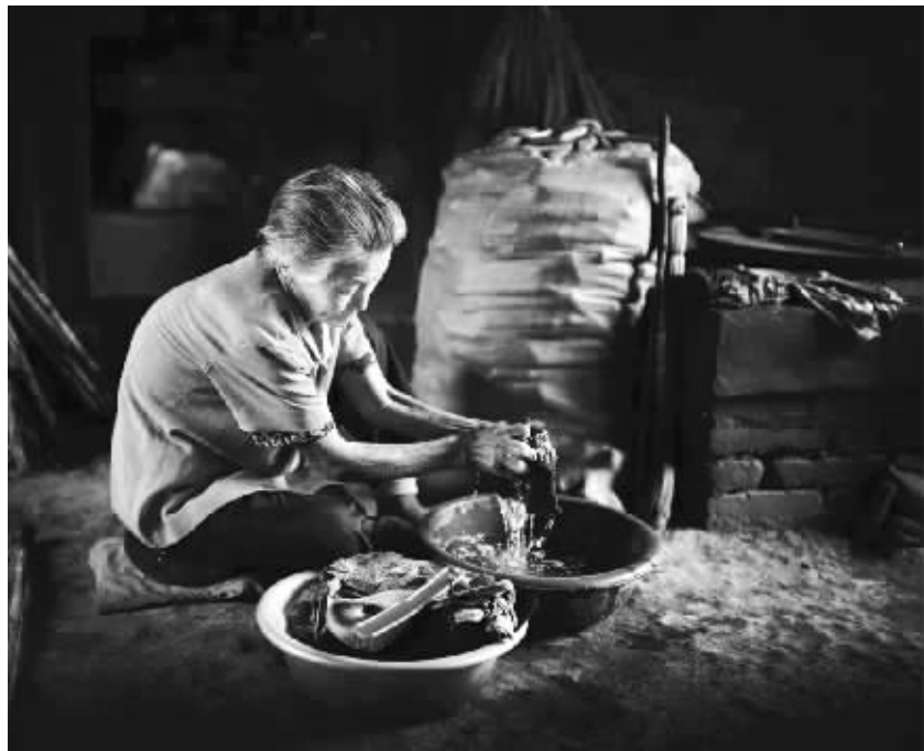
岁月长河中的母亲

城市的空调和乡村的电暖扇,早已代替火炉驱散了寒冷,但也驱散了一家人围炉烤火的那份欢乐那份温馨。我们回城的时候,昂不舍,说:“过个星期我们还回奶奶家吧,还一起围着炉子烤火。”我和燕点头答应。母亲高兴地说:“好啊,好啊。”说着,眼里有了泪花。我想,再回来,一定要买个新火炉。