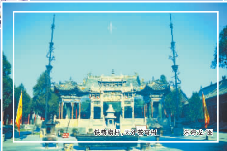
铁铸旗杆，天外苍穹树