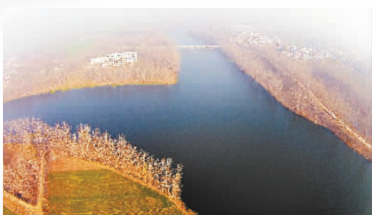
沙河与颍河交汇处