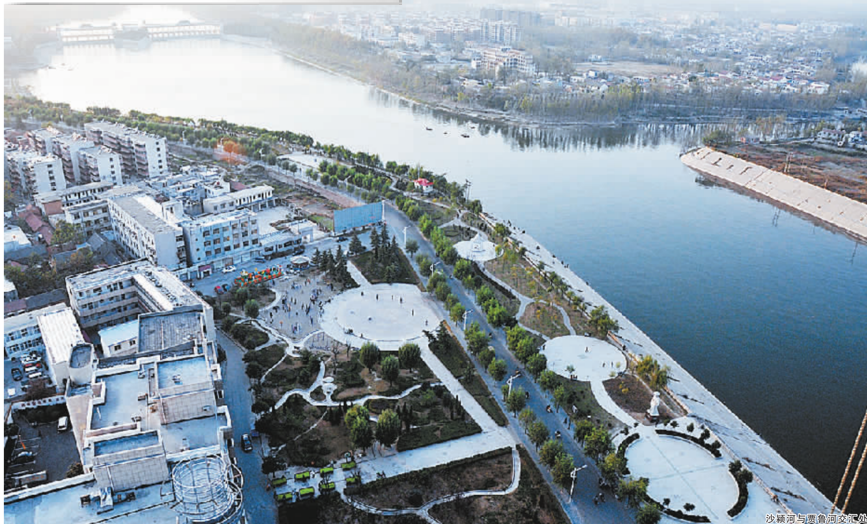
沙颍河与贾鲁河交汇处