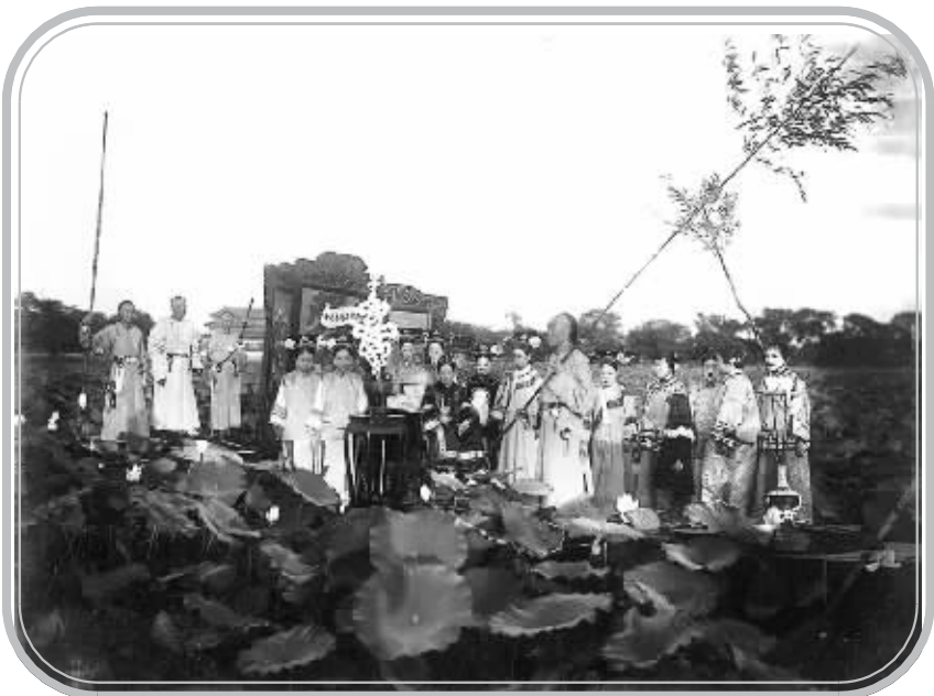
慈禧与光绪皇后、瑾妃、德龄、德龄之母、元大奶奶、奕劻三女儿、四女儿及李莲英等在中海乘平底船。(影像志)