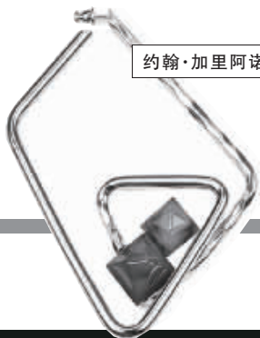
约翰·加里阿诺耳环