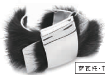
萨瓦托·菲拉格慕手镯