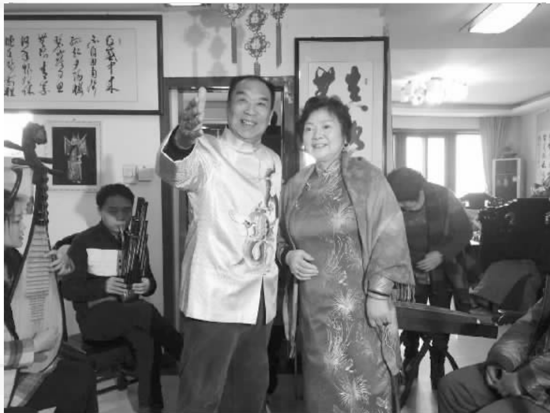
王宽夫妇在孩子们的伴奏下表演节目