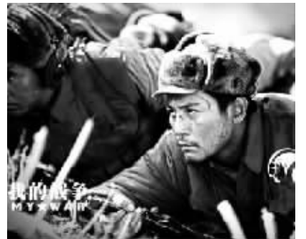
《我的战争》宣传海报