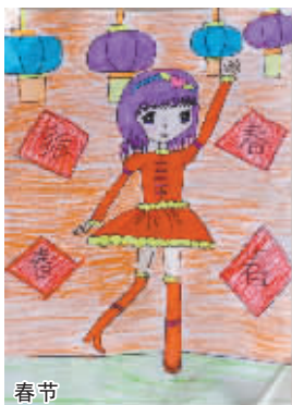
小记者：高韵淇 编号：161234 学校：作坊小学班级四（4）班

本栏目刊发小记者的书法、绘画、摄影等作品。小记者们如果你有这些爱好，快快拿起手中的笔开始创作吧！作品创作完成后，请用相机拍下来发送到 zkwbxjz@126.com