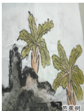
小记者：宋易轩 编号：162135 学校：周口六一路小学五（1）班