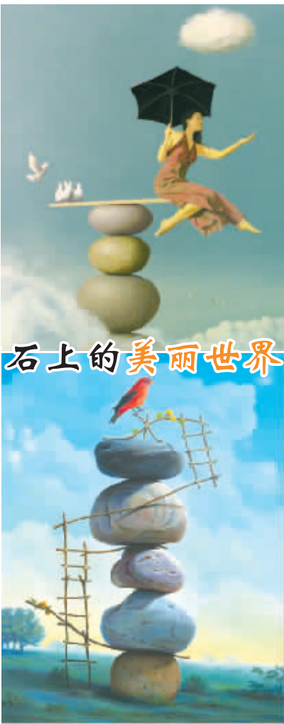
鹅卵石上的美丽世界