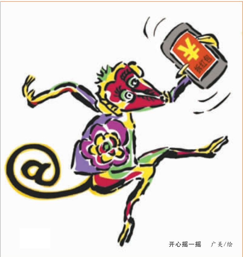
开心摇一摇 广美/绘

监考老师:试卷有不清楚的,可以举手发问。 学生:老师!前面同学的试卷很不清楚,他都不问!