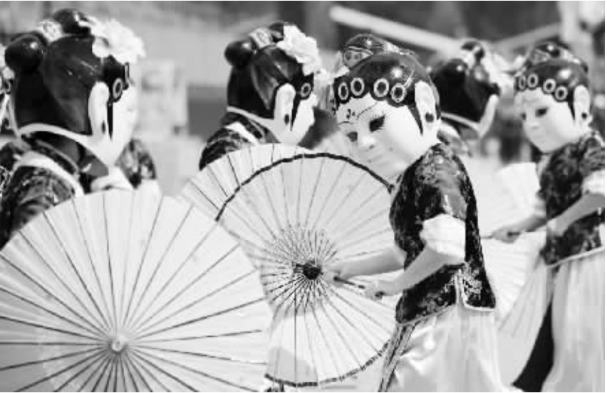
2月18日,来自中国福建省福州市闽都民俗艺术团的表演者在新加坡F1赛道表演节目《两百五十婆姐贺新春》。 当日,新加坡妆艺大游行海外表演团媒体预演在新加坡F1赛道举行。新加坡妆艺大游行将于2月19日和20日正式举行。