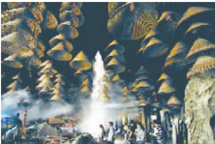
▲《西游记》取景地：肇庆仙女湖出米洞

石林位于云南省昆明市石林彝族自治县境内，是世界自然遗产。它拥有世界上喀斯特熔岩地貌演化历史最久远、分布面积最