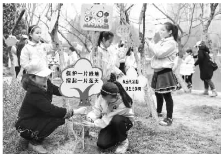
3月17日,小学生与志愿者一起将护绿主题提示牌树立在园林中。

当日,合肥市铜陵路街道青年志愿者与蚌埠路第三小学的孩子,在合肥市花冲公园开展以“爱绿,护绿,共建绿色家园”为主题的“3·21”世界森林日护绿活动。活动中,孩子们与志愿者将精心制作的“爱绿护绿”提示牌树立在游园内,并为园区树木浇水、除草,在培养爱护环境意识的同时,向社会传递“爱绿护绿”正能量。