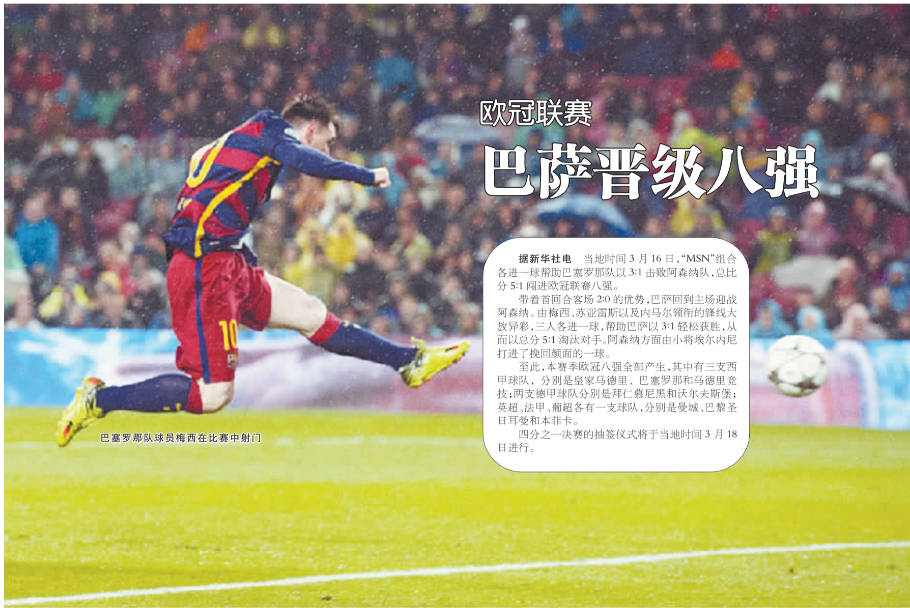
巴塞罗那队球员梅西在比赛中射门