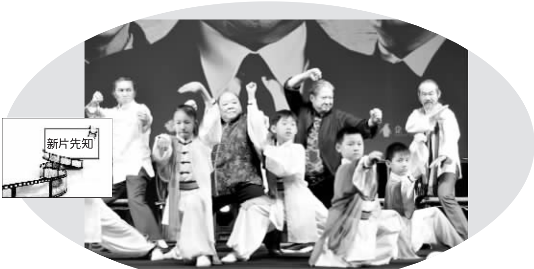
洪金宝、七小福成员元华等与小朋友一起表演功夫

本报综合消息 由洪金宝执导并主演、刘德华监制并特别出演的电影《我的特工爷爷》于 4 月 1 日全国公映。3 月 29 日晚,该片在北京举行首映礼,除了洪金宝、朱雨辰、冯嘉怡、陈沛妍、“七小福”成员元华、元庭、元宝等主演外,梁家辉、冯绍峰等也亮相助阵。洪金宝表示该片是他从影 40 年以来最辛苦的一次经历,但洪金宝笑言“我准备继续打到 150 岁,(这都没有关系)”。