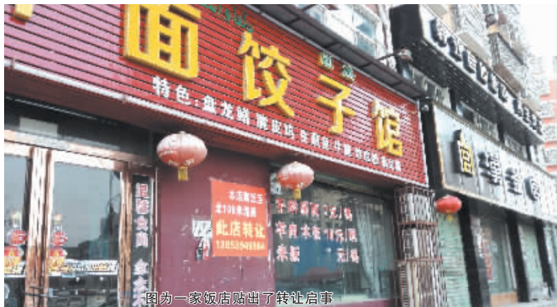
图为一家饭店贴出了转让启事