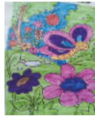
小记者:赵雅琨 编号:160388 学校:周口实验小学三(2)班