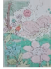
小记者:杨晨 编号:165317 学校:西华县西关小学五(1)班