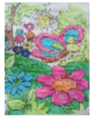
小记者:张一博 编号:160143 学校:周口李庄小学六(3)班