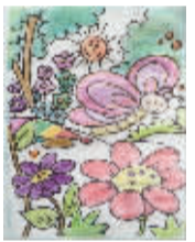
小记者:陈雅雯 编号:162062 学校:周口六一路小学三(3)班