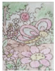
小记者:赵祿琪 编号:161676 学校:周口文昌小学四(1)班