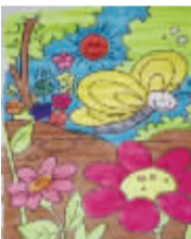
小记者:彭治豪 编号:161173 学校:周口闫庄小学五(5)班