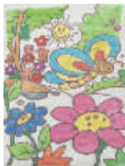
小记者:刘滋润 编号:161167 学校:周口闫庄小学五(4)班