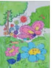
小记者:李嘉妍 编号:160302 学校:周口实验小学二(3)班