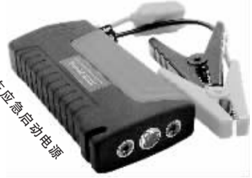
汽车应急启动电源