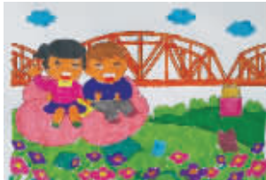
小记者:王烁 编号:161275 学校:周口七一路二小三(2)班