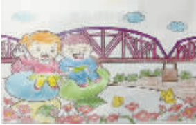
小记者:苑馨可 编号:162035 学校:周口六一路小学三(6)班