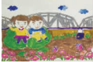
小记者:李依宸 编号:161980 学校:周口六一路小学二(7)班