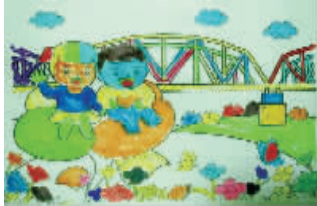
小记者:刘一朴 编号:161811 学校:周口六一路小学二(6)班