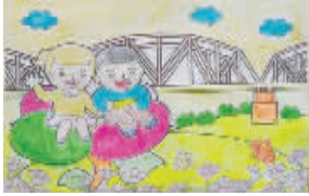
小记者:郭恬恬 编号:160129 学校:周口李庄小学五(3)班