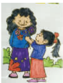
小记者：董若涵 编号：160680 学校：周口五一路小学 三(4)班