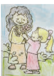
小记者：刘擎 编号：161030 学校：周口闫庄小学二(5)班