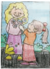
小记者：李沐春 编号：160511 学校：周口实验小学四(4)班