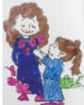
小记者：胡智勇 编号：161647 学校：周口文昌小学四(5)班