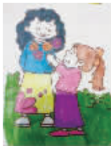
小记者：郭锦瑶 编号：160698 学校：周口五一路小学四(3)班