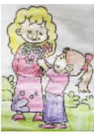
小记者：韩雨轩 编号：161863 学校：周口六一路小学二(2)班