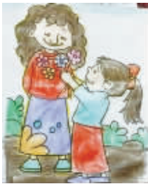
小记者：王茜 编号：165289 学校：淮阳西关小学四(3)班