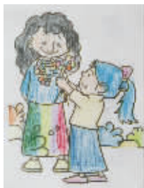
小记者：唐子鸣 编号：161293 学校：周口七一路二三(3)班