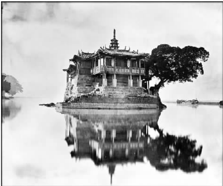
闽江上一幢建在小岛上的庙