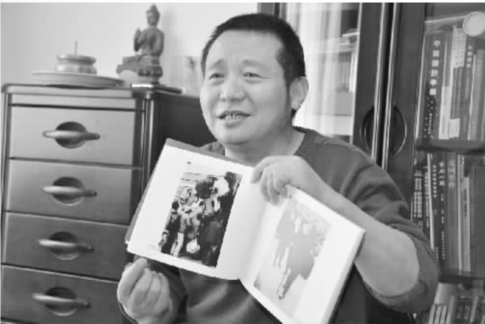
杨峰介绍摄影作品背后的故事