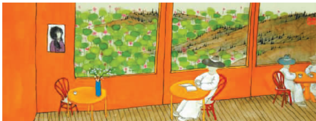
夏日的晚风,寂寞的花枝。拥半盏清茶,对一册古诗。老树画画

富豪心动了,立即买了车。没想到,第二天就出了车祸。富豪非常恼火:“我这么牛的车牌你也敢撞?胆子可真不小!”下车一看,富豪立刻服了。原来,对方的车牌号是:44944(试试就试试)。